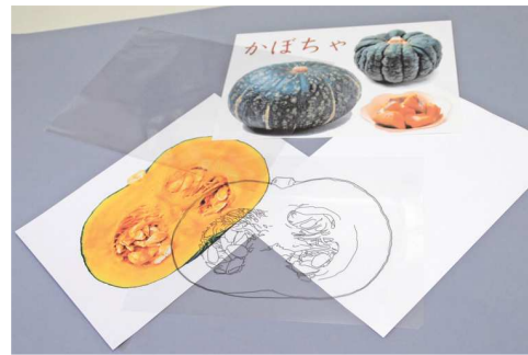
すぐに始めるセットの一部