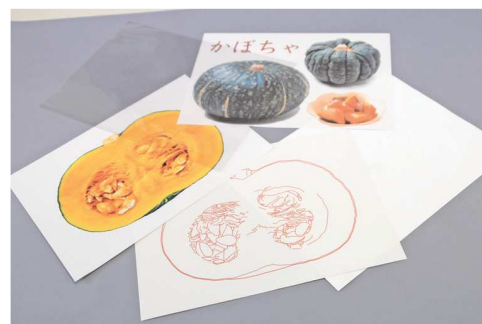
自分で作成セットの一部

春編 5品・自分で作成セット 1,280円 (輪郭線ガイド、予備シュリンク3枚、厚紙2枚付) 初夏編 5品・自分で作成セット 1,280円 (輪郭線ガイド、予備シュリンク3枚、厚紙2枚付) 春編 5品・すぐに始めるセット 3,500円 (輪郭線印刷済フィルム、厚紙2枚付) 初夏編 5品・すぐに始めるセット 3,500円 (輪郭線印刷済フィルム、厚紙2枚付)